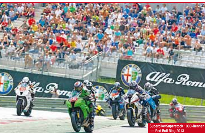
Superbike/Superstock 1000-Rennen am Red Bull Ring 2013

Neu in diesem Jahr ist die in die Klasse Superbike integrierte, aber separat gewertete Klasse Superstock 1000. Nach internationalem Vorbild kommen hier technisch noch näher an der Serie belassene 1000er-Maschinen zum Einsatz. Weiterhin sorgen die bekannten Klassen Supersport 600 (seriennahe 600er), Moto3 (Prototypen mit 250-ccm-Viertaktmotoren analog der GP3-Serie), sowie die Sidecars für spannende Rennen. Garniert werden die Renntage mit dem Yamaha R6-Dunlop-Cup und dem ADAC Junior Cup, in welchem Nachwuchspiloten ab zwölf Jahre mit 125-ccm-Motorrädern mit bis zu 160 km/h um die ersten Erfolge ihrer Karriere kämpfen.